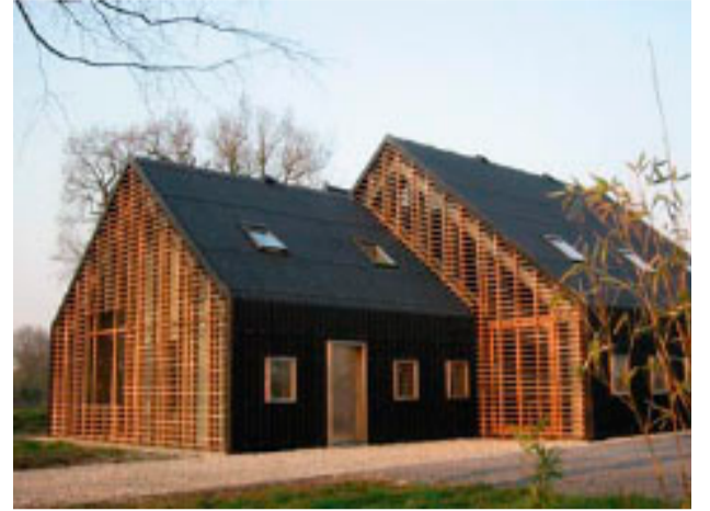
voorbeelden van woon-werk combinaties