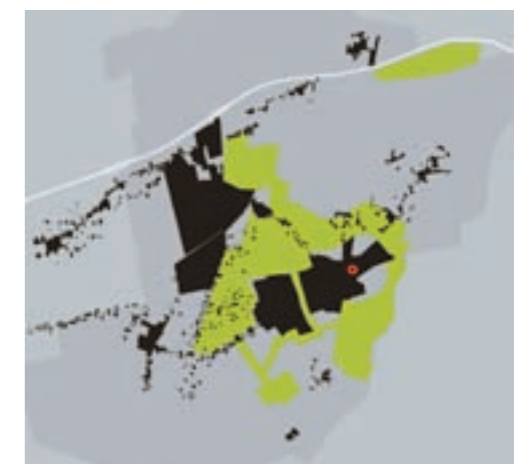
Locatie Roden centrum