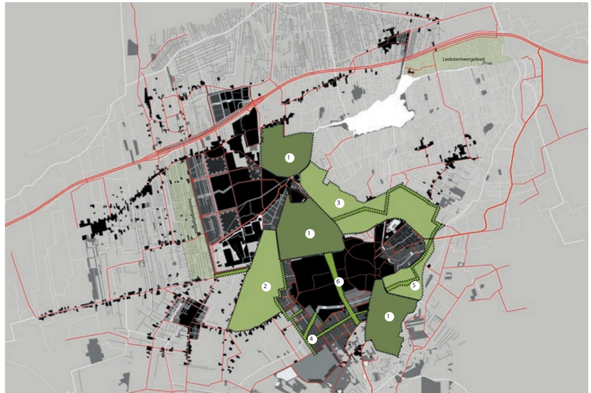
De onderdelen van het landschapspark

3. Het Potkleigebied tussen Roden en Nietap, het vierde landgoed. Het potkleigebied is onderdeel van het esdorpenlandschap. De bijzonderheid van dit landschapselement wordt voornamelijk verklaard vanuit de geomorfologische gegevenheden, met als resultaat dat veel potklei aan de oppervlakte komt. De typische landschappelijke structuur van lanen en houtwallen, gecombineerd met de aanwezigheid van een bijzondere kruidenvegetatie, maken het tot een aantrekkelijk