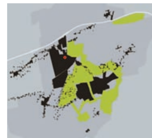
Locatie Leek centrum