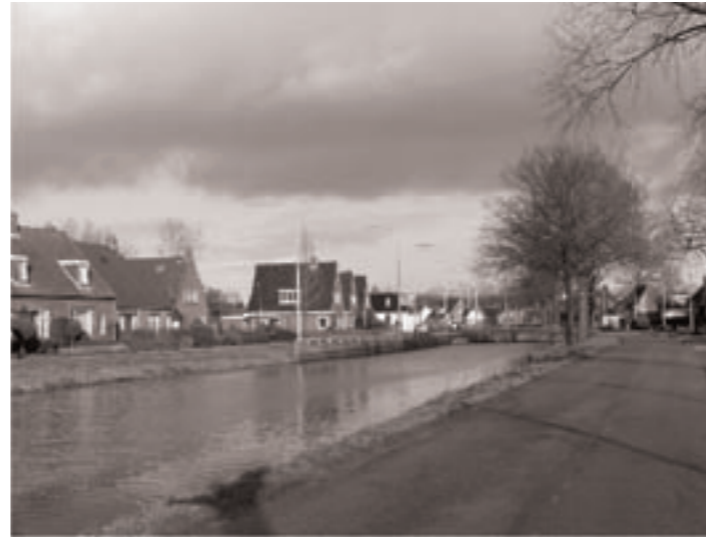
Leekster Hoofddiep mager beplant

Bij de ontwikkeling van het gebied zal gekeken worden in hoeverre de verstedelijkingsopgave een substantiële bijdrage kan leveren aan het gebruik en de beleving van het landschap.