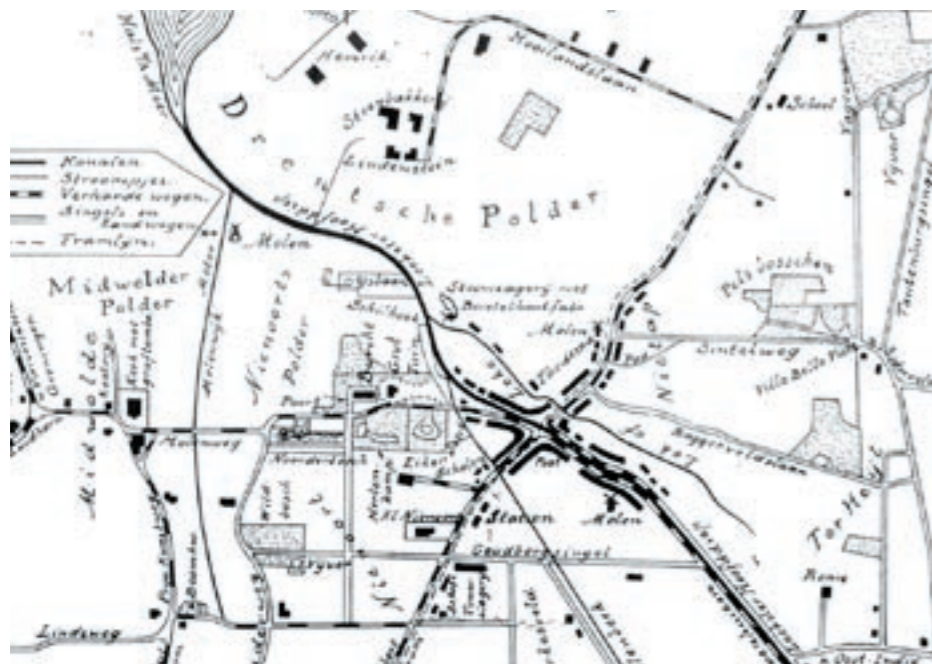
wandelkaart leek en omstreken, 1913

Het recreatief gebruik van het gebied rondom Leek en Roden bestaat uit een verzameling van interessante plekken, objecten en gebieden. Daarnaast bevinden zich een aantal officiële recreatieve fietsroutes door het gebied. De grote trekpleisters zijn het landgoed Nienoord en de Zuursche Duinen ten zuiden van Roden. Opvallend is dat het Leekstermeer met een waterverbinding naar het noorden, het dorp Roden en het landgoed Mensinge een zeer bescheiden rol spelen in de totale recreatieve beleving van het gebied. De fietsroutes in het gebied zijn fragmentarisch van opzet. De enige route die op verschillende manieren is af te leggen is die van Roden naar de stad Groningen.