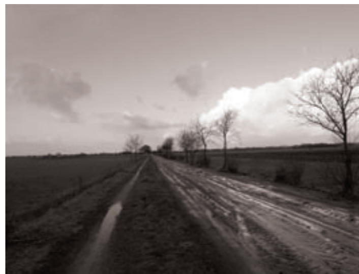
magere beplanting op Steenbergerveld