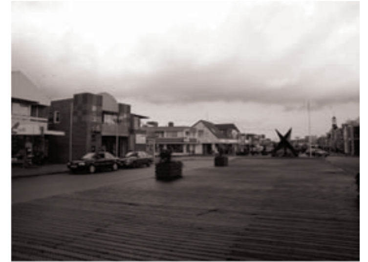
voormalige Leekster Hoofddiep