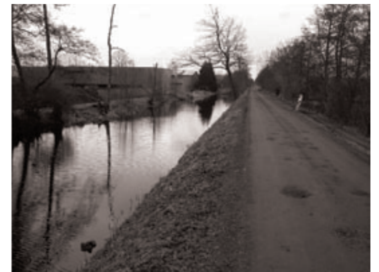
vervallen sfeer langs Tolbertervaart