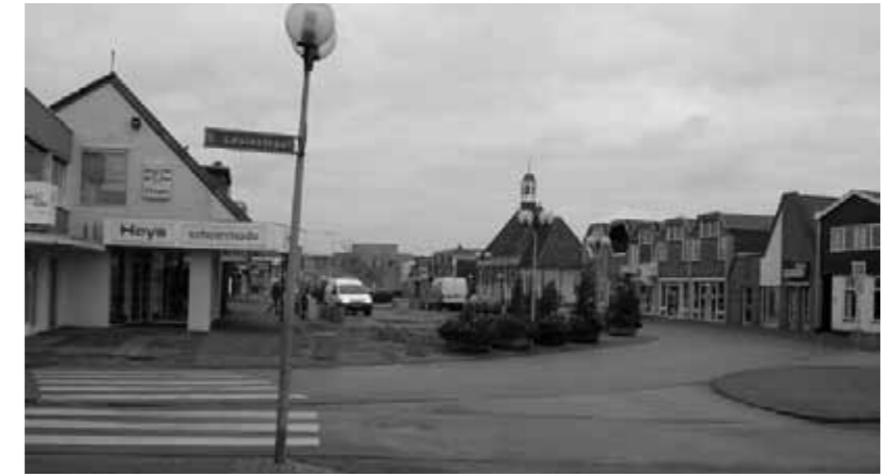
identiteit centrum Leek