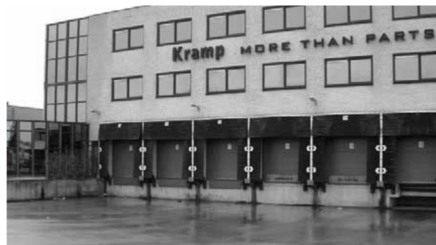
Tolbert, loadingdock- bedrijventerrein op verkeerde locatie