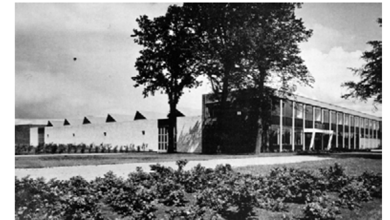
industrie ontwikkelingen Leek en Roden in de jaren 50'-60'