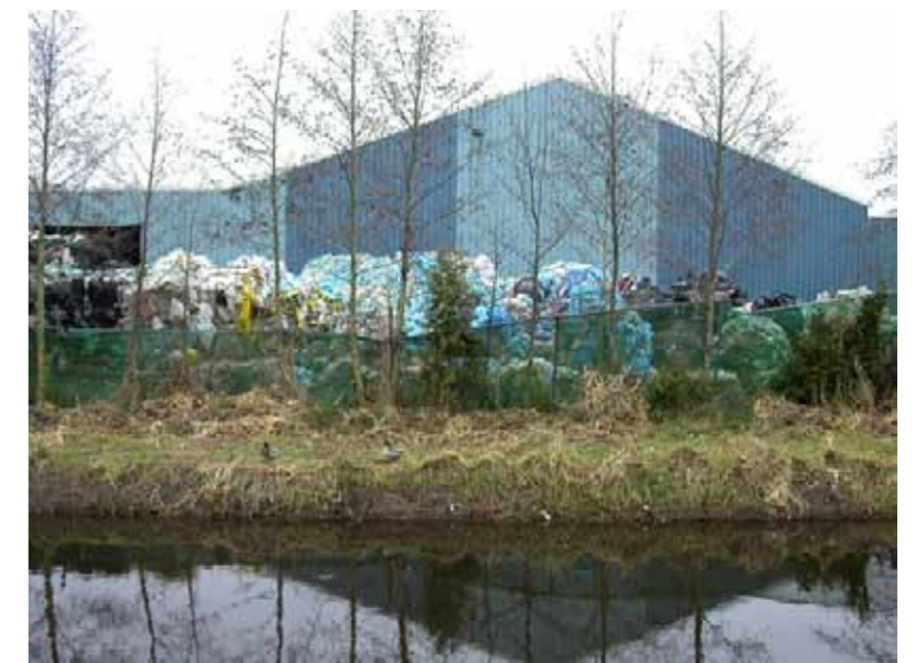
Leek, bedrijventerreinen aan de Tolbertervaart