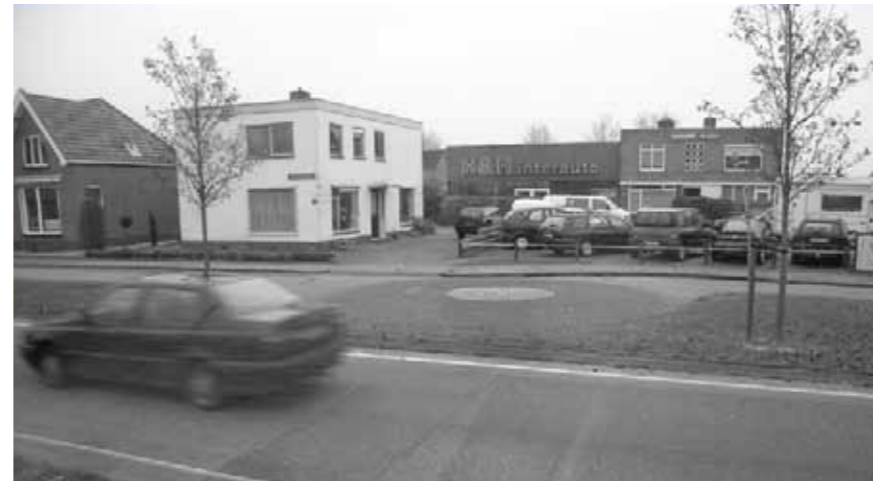
verkeerde positie en identiteit van kantoren en industrie

Zevenhuizen is een typisch ontginningsdorp met als ontginningsbasis een vaart. Deze vaart is echter nog maar gedeeltelijk aanwezig. Hiervoor in de plaats is een breed profiel gekomen waarop het lokale pompstation zich als een monument manifesteert. Pas in tweede instantie kan de kerk en het dorpsplein worden waargenomen.