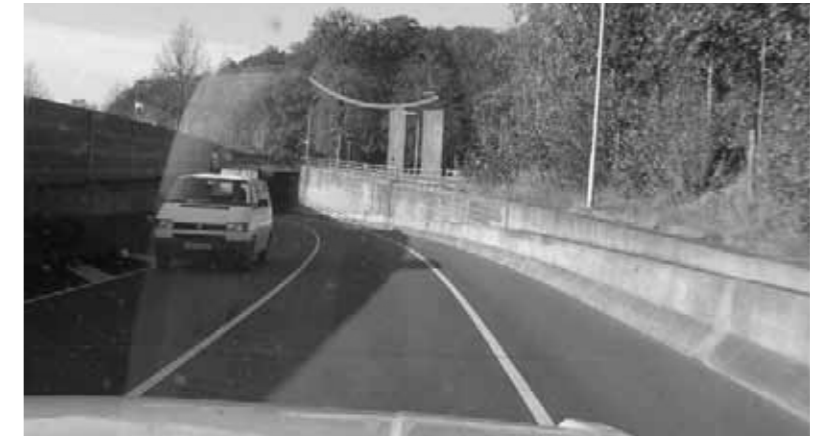
tunnel tussen Leek en Nietap