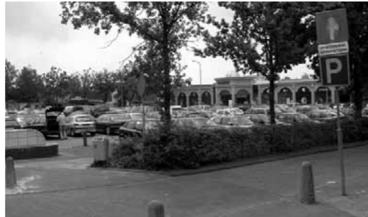
Roden: forse uitbreiding centrum legt ook claim op openbare ruimte

De oorsprong van Leek ligt bij de oversteek over het Leekster Hoofddiep. Juist op deze plek zijn de afgelopen decennia forse veranderingen opgetreden die de identiteit van het dorp niet ten goede komen. Zo is het Leekster Hoofddiep uit het centrum verdwenen en is de oude brug eveneens verdwenen. In plaats hiervan is de oude weg nu om Nietap en Leek geleid in de vorm van een tunnel, en is in het centrum een plein gemaakt. Het feit dat op de website van Leek wel oude foto's van deze plek worden getoond maar geen recente opnames spreekt boekdelen. Naast het verloren hart is de relatie tussen het centrum en de uitbreidingen moeizaam. Omdat de uitbreidingen meer noord-zuid zijn georiënteerd ontbreekt een goede oost-west relatie. Door de aanwezigheid van bedrijventerreinen op strategische locaties in het dorp lijkt het erop dat Leek zich verschanst achter de bedrijven. Het feit dat Leek en Tolbert bewust aan elkaar zijn gegroeid ondergraaft ook hier de kwaliteit van de identiteit van de plek.