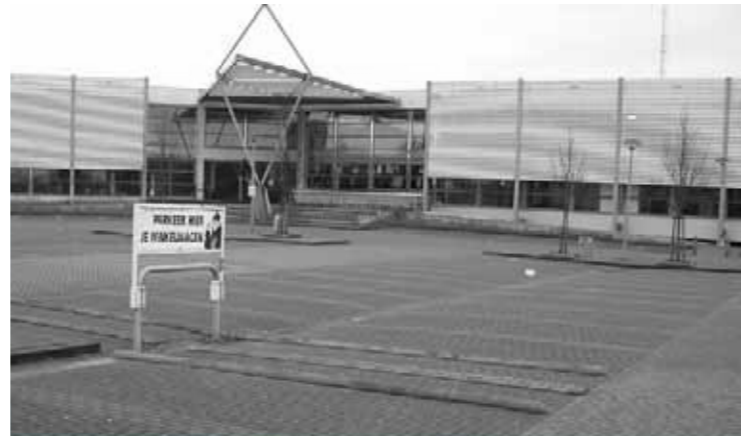
Roden: openbare ruimte wordt gedomineerd door parkeren