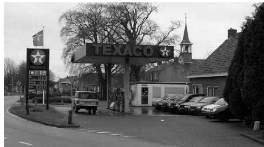
identiteit centrum zevenhuizen

Zo is Roden door de aanleg van industrieterreinen met een onduidelijke structuur en de nieuwe rondweg de relatie met het Leekstermeer kwijt geraakt. Ook in Leek is de relatie met het landschap vaak slecht. Aan de westzijde liggen achterkanten van bedrijventerreinen aan de Tolbertervaart en aan de zuidzijde is de zuidkant van het Leekster Hoofddiep een rommelig gebied met onduidelijke oriëntaties. Aan de oostkant van Leek heeft ondertunnelde Van Nassauweg niet geleid tot een hechtere relatie tussen Leek en Nienoord.